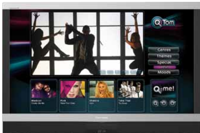
MultyVision ISIO 46